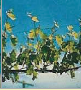
Sürgünler 20-25 cm olunca