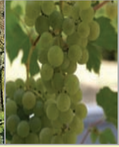
Danelere tatlı su yürümeye başladığında