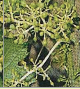
Koruklar nohut iriliğinde olunca