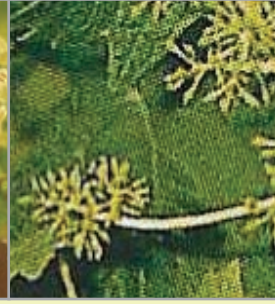
Koruklar saçma iriliğinde olunca