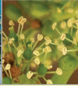
Çiçek tomurcuğu dönemi