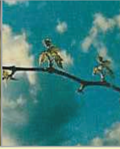
Yaz ilaçlamasından 20 gün sonra